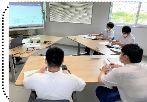
【 社内研修 】