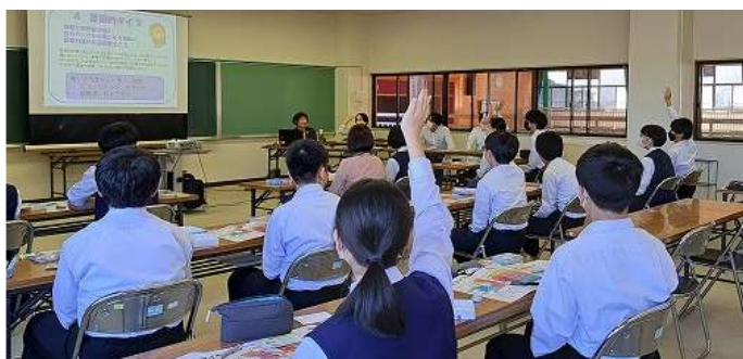
「シゴト☆ジブン発見カードセミナー+地元の企業発見セミナー」の様子