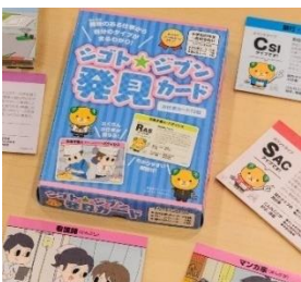
▲ 72種類の仕事がかかれていて

さまざまな職業を知るだけでなく、自分の興味や強み、特徴などを見つけることができる自己理解ツールでもあります。