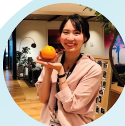
女将/フリーランス